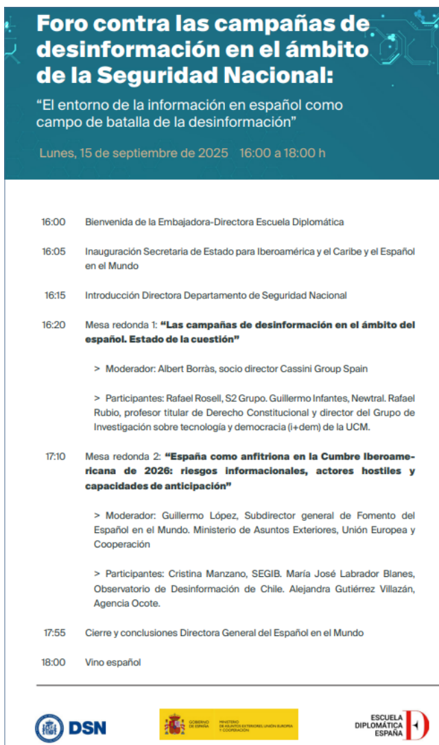
Figura 2: Programa de la conferencia: "El entorno de la información en español como campo de batalla de la desinformación"